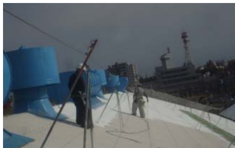
仕上カラーコーティング