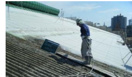
ケミカルカチオンコーティング