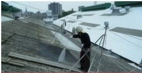
浸透プライマーコーティング