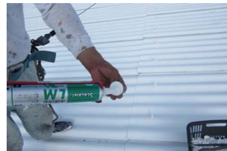
フックボルト処理

ビニール製のキャップにシーリング剤を充填し取付けボルト周辺からの雨漏れを防ぎます。